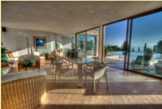
Poolhaus Poggio Bianco

Sie erleben die toskanische Küche und feine Weine zur Einstimmung auf eine wunderbare Woche in einer Region, die vier Fünftel der Kunstschätze Italiens hütet.